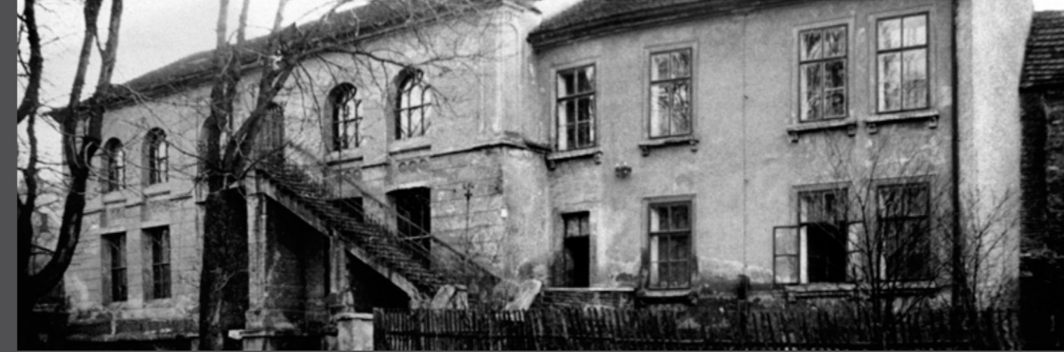
Synagoga a škola (1942)