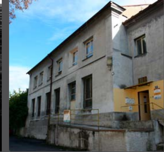
Bývalá synagoga (dnešní stav)